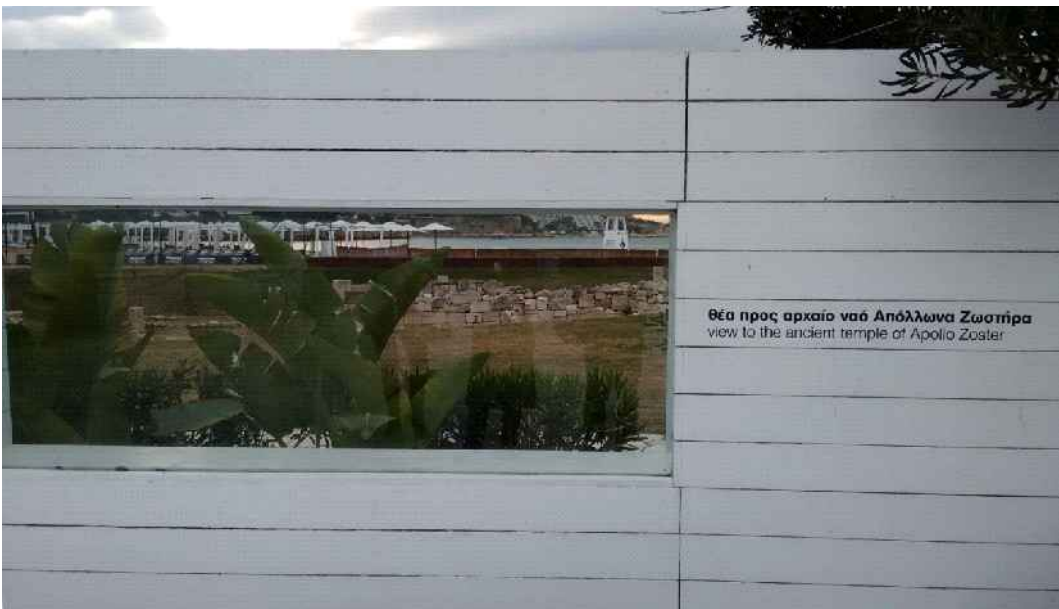
Εικ. 4: Το παράθυρο στην περίφραξη με θέα προς τον αρχαίο ναό.