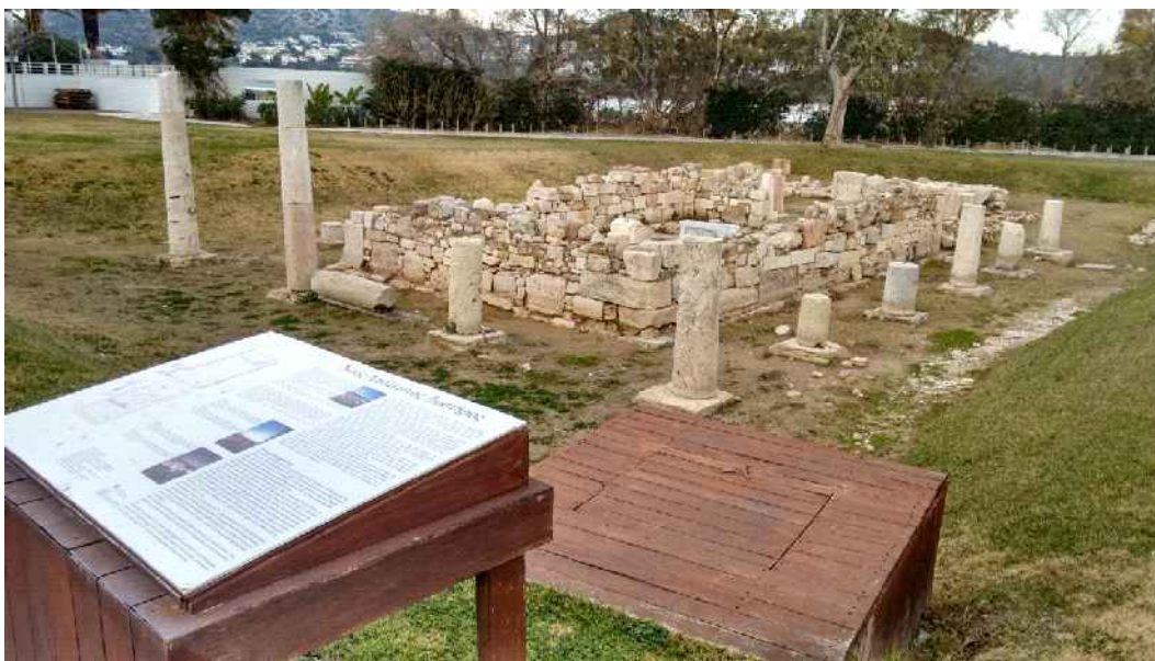
Εικ. 2: Ο ναός του Απόλλωνα Ζωστήρα από ΝΔ.