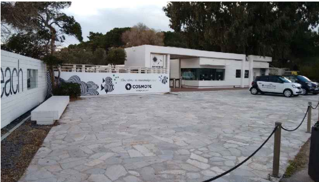
Εικ. 3: Η είσοδος της οργανωμένης ακτής Αστέρας Βουλιαγμένης.